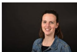
Joke Raes Administratie