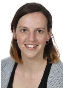
Joke Raes Administratie